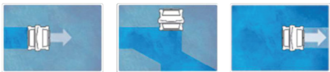
De reiging in één cyclus